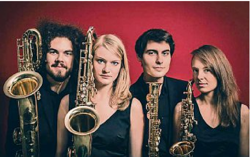
Das Arcis Saxophon Quartett

cher am Freitag, 4. März um 19.30 Uhr ein ganz besonderer Musikgenuss. Mit großer Leidenschaft begeistern die vier jungen Musiker aus München das Publikum und lassen durch ihre charismatische Bühnenpräsenz in dieser seltenen Formation der Kammermusik den Funken überspringen. In hochprofessioneller Feinarbeit loten sie das Verhältnis von individueller Aussagekraft und kammermusikalischer Verwobenheit aus. Sie entwickeln dabei eine Spielfreude und eine Tiefe von Ausdruck, die den Zuhörer bannt. Ihr Hauptinteresse liegt sowohl in der Ergründung der klassischen Originalliteratur als auch darin, mit modernen Werken und Auftragskompositionen neue Impulse für die Kammermusikwelt zu setzen. Nach dem internationalen Debüt im Großen Saal des Tschaikovsky Konservatoriums in Moskau 2013 folgte im Januar 2016 die Einladung in den Olymp der Kammermusik: Die legendäre Wigmore Hall in London. Der Eintritt kostet 17 Euro, im Vorverkauf 15 Euro.