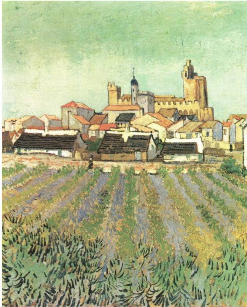
Vue sur Saintes Maries de la Mer- Vincent Van Gogh http://www.bilderkostenlos.org/Kuenstler/van%20Gogh/Blick-auf-Saintes-Maries.JPG.html