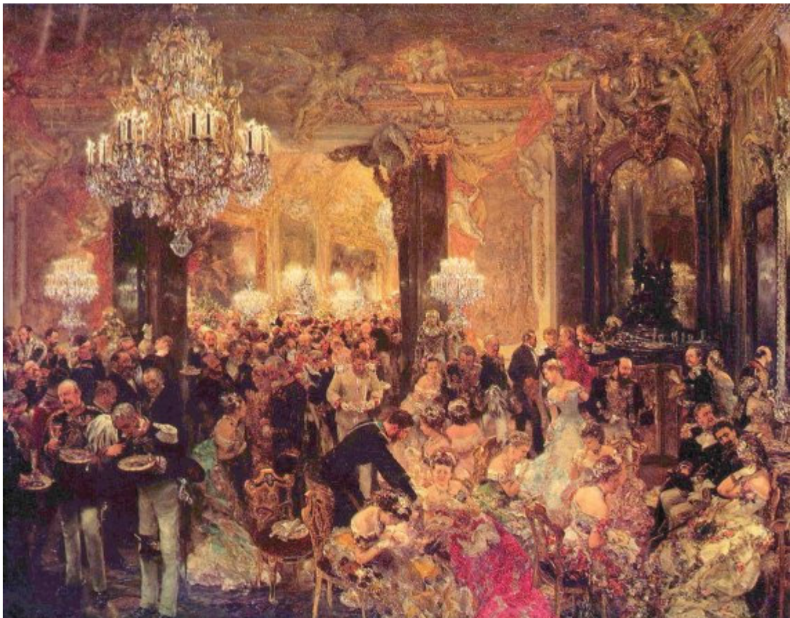
Ballsouper – Adolph Menzel

http://www.bilderkostenlos.org/Kuenstler/Camille%20Pissarro/Boulevard-Montmartre.jpg.html