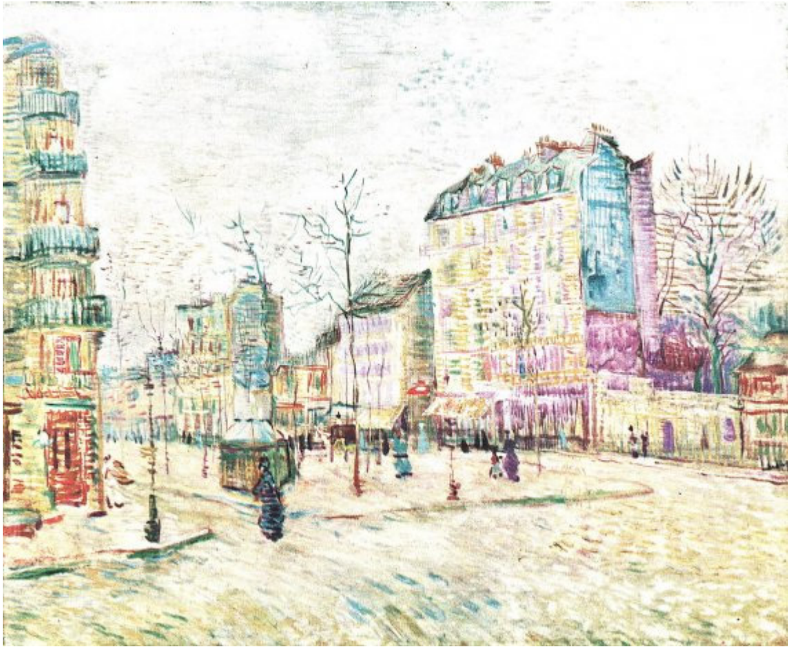
Boulevard de Clichy – Vincent van Gogh

http://www.bilderkostenlos.org/Kuenstler/van%20Gogh/Boulevard-de-Clichy.JPG.html