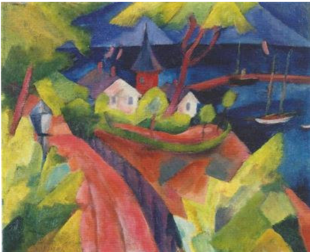
Wieck near Greifswald – Paul Adolph Seehaus – 1916

http://www.bilderkostenlos.org/Kuenstler/van%20Gogh/Boulevard-de-Clichy.JPG.html