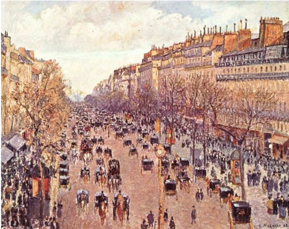
Boulevard Montmartre – Camille Pissaso

http://www.bilderkostenlos.org/Kuenstler/Camille%20Pissarro/Boulevard-Montmartre.jpg.html