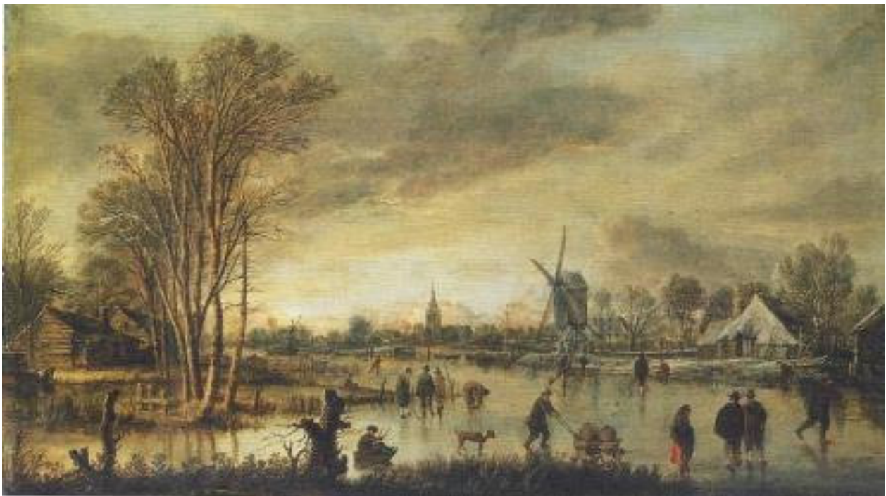
Landscape with river in winter - Aert van der Neer - 1645