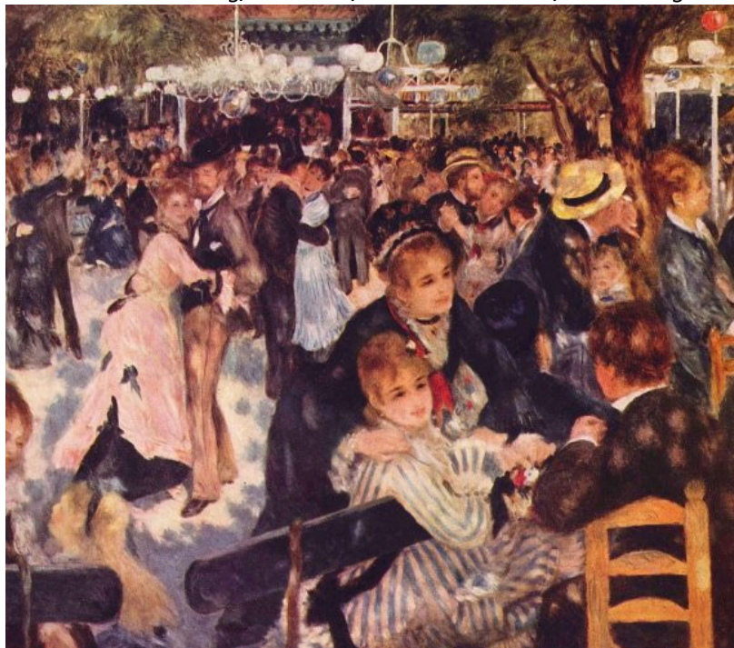
Le bal du Moulin de la Galette – Auguste Renoir

http://www.bilderkostenlos.org/Kuenstler/Claude%20Monet/das-Mittagsmahl.jpg.html