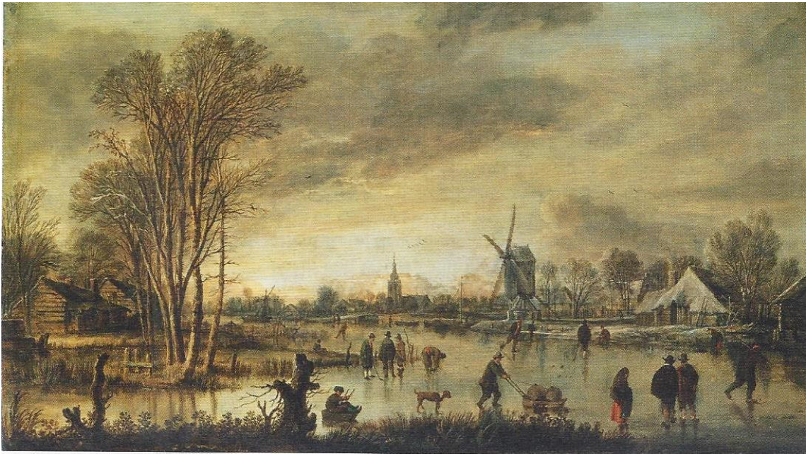
Landscape with river in winter – Aert van der Neer – 1645