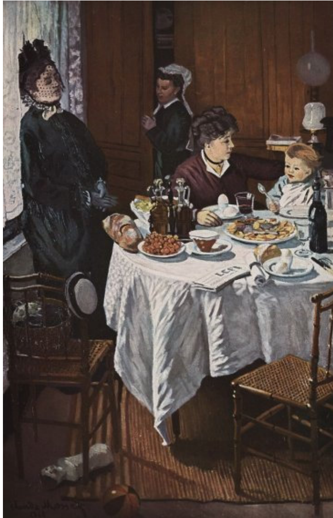
Le déjeuner – Monet

http://www.bilderkostenlos.org/Kuenstler/Paul%20Cezanne/Das-Haus-von-Dr-Gachet.jpg.html